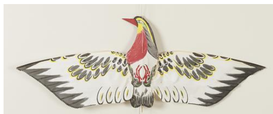
鳥凧(台湾) (当館寄託)