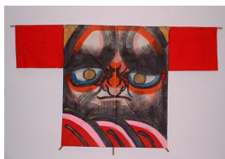
袖凧 達磨(群馬県) (当館寄託)

当館に寄託された300点を超える山鹿郷土凧コレクションの中から選りすぐりの凧を、由来・背景、凧にまつわる風習とともに紹介します。日本各地の凧を始め、中国や台湾、ブラジルの凧など世界の凧も展示します。