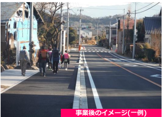
事業後のイメージ(一例)