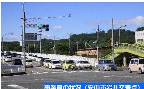
事業前の状況（安中市岩井交差点）

◆通勤時間帯を中心に交通渋滞が発生しており、移動に時間がかかるため、高崎・安中～富岡を結ぶ防災・物流拠点集積エリア間の円滑な移動に支障がありました。