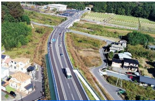
事業後の状況（安中トンネル付近）

◆バイパス整備により、安中地域において移動が円滑になり、災害時においても広域的な救命救助や被災地への支援物資輸送などが可能になりました。