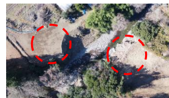
（仮称）黒石1号橋下部工箇所