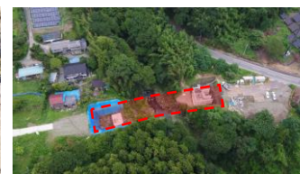
（仮称）黒石2号橋上部工箇所