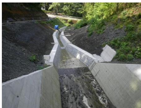
事業後のイメージ (一例)