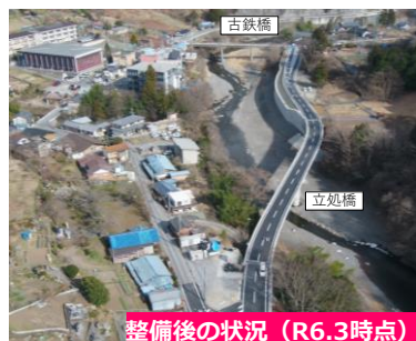
整備後の状況 (R6.3時点)