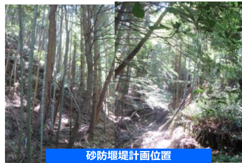
砂防堰堤計画位置