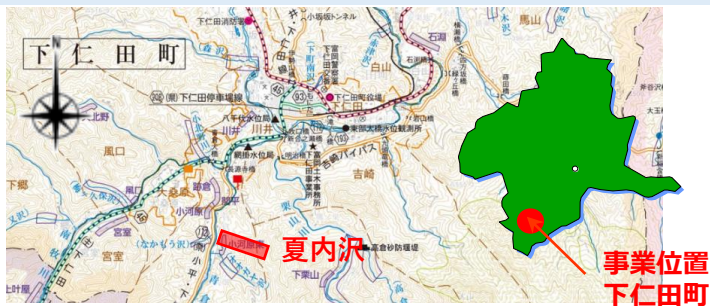
事業位置 下仁田町