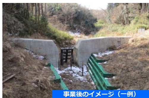
事業後のイメージ (一例)