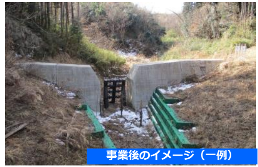
事業後のイメージ（一例）