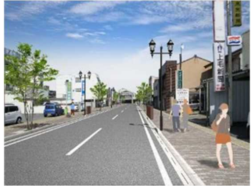
事業後のイメージ（一例）

◆電線類を地中化することで、すっきりとしたまち並になり、良好な都市景観が創出されます。