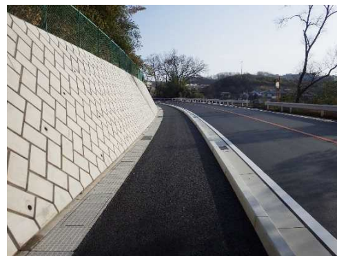
完成後のイメージ（一例）