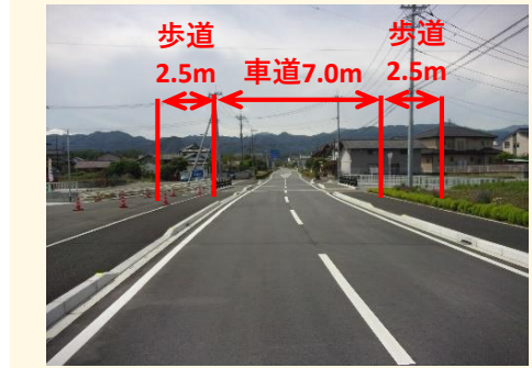
事業後のイメージ