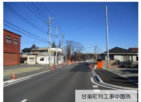
甘楽町側工事中箇所