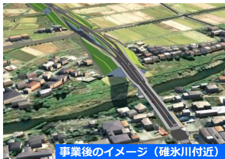
事業後のイメージ（碓氷川付近）