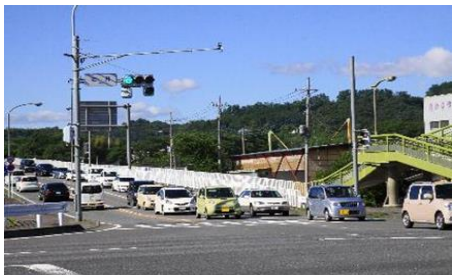
事業前の状況（安中市岩井交差点）