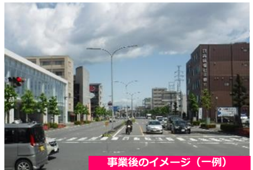
事業後のイメージ (一例)