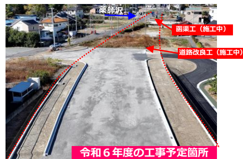
令和6年度の工事予定箇所