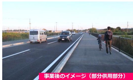
事業後のイメージ (部分供用部分)