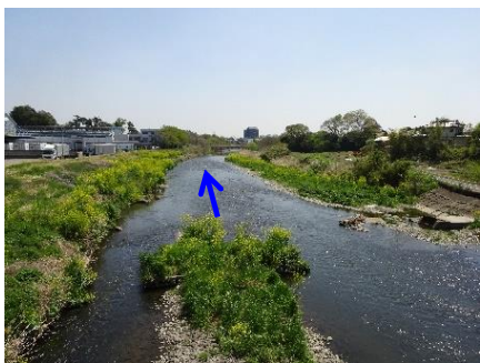
事業前の状況（常慶橋下流）