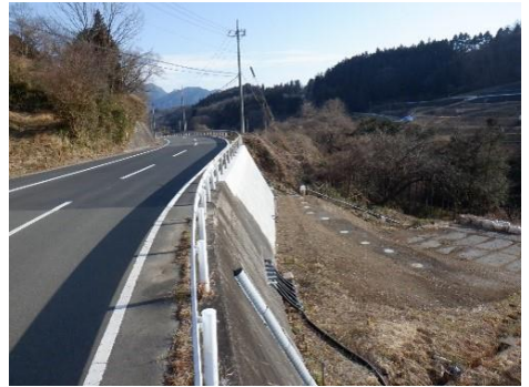
事業後のイメージ（一例）