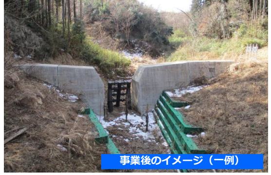
事業後のイメージ（一例）

◆ 砂防堰堤の整備により、大雨などによる土石流や流木の被害のリスクを軽減します。