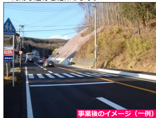
事業後のイメージ（一例）