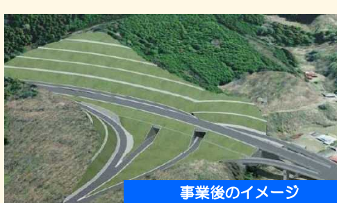
事業後のイメージ (植栗・中之条IC完成後)

◆国道145号の危険箇所を回避し、災害時の代替路となる新たな道路ネットワークが確保されます。 ◆高速道路に準じた速達性と定時性の高い走行が可能となり、移動時間が短縮されます。