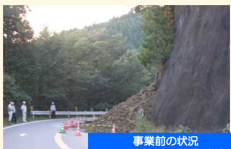
事業前の状況 (H18.10発生の斜面崩壊)

◆現道の国道145号は斜面崩壊の発生箇所や急傾斜地崩壊危険区域が存在し、緊急輸送道路でありながら、災害時に通行止めとなるおそれがあります。