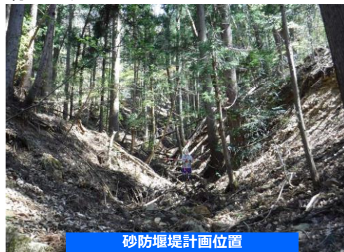
砂防堰堤計画位置