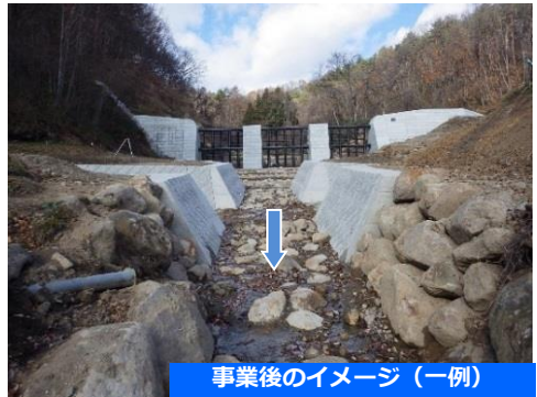
事業後のイメージ（一例）