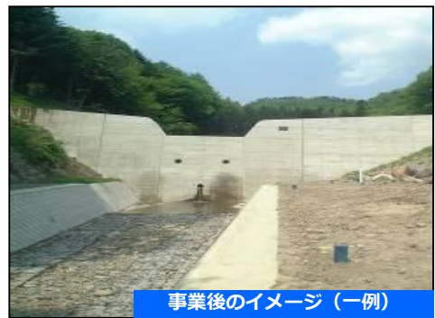
事業後のイメージ（一例）