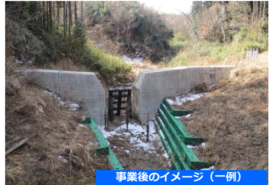
事業後のイメージ（一例）