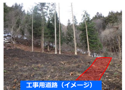
工事用道路（イメージ）