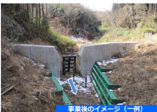
事業後のイメージ（一例）

◆砂防堰堤の整備により、大雨などによる 土石流や流木の被害のリスクを軽減します。