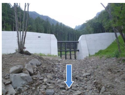
事業後のイメージ (一例)