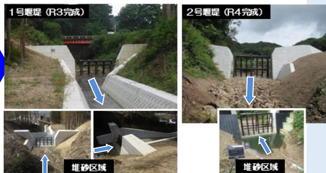
事業後の状況（1、2号堰堤）