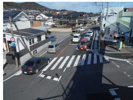
事業後のイメージ (一例)