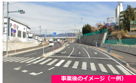
事業後のイメージ (一例)