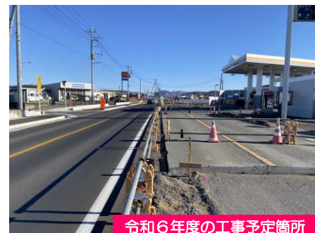
令和6年度の工事予定箇所