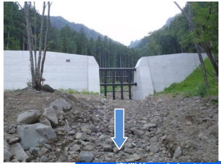
事業後のイメージ