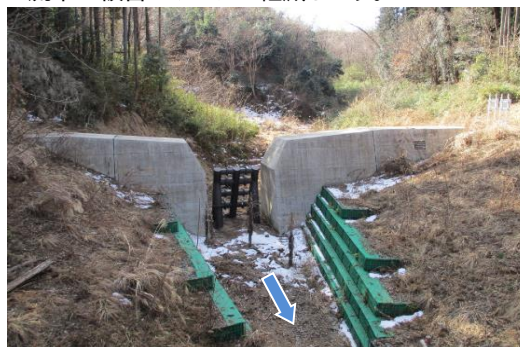
事業後のイメージ