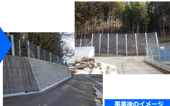
事業後のイメージ