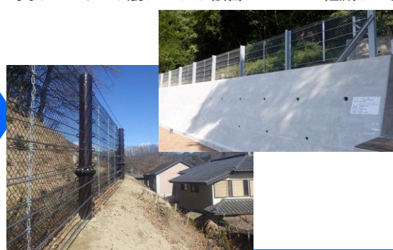
事業後のイメージ