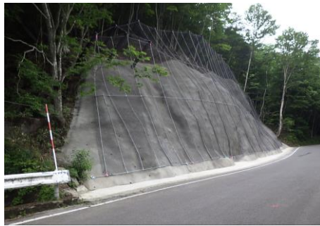
事業後のイメージ