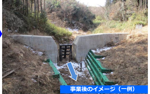
事業後のイメージ（一例）