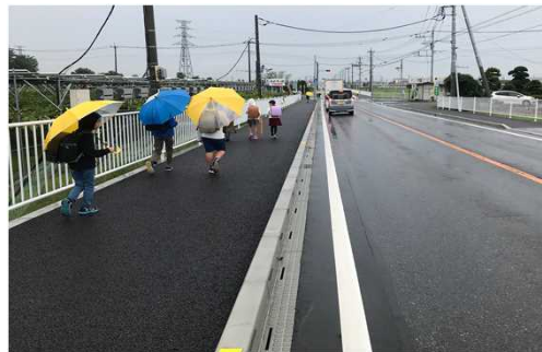
事業後のイメージ (一例)