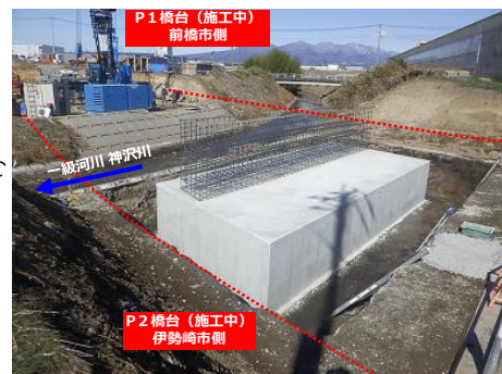
P1橋台 (施工中) 前橋市側