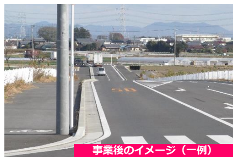
事業後のイメージ (一例)

◆道路新設により、波志江スマートICへのアクセス性が改善し、移動時間を短縮します。 ◆上武道路との交差点には右折レーンが設置され、交通渋滞を緩和します。