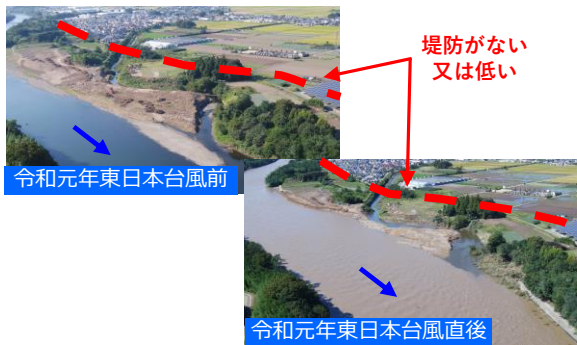
令和元年東日本台風前