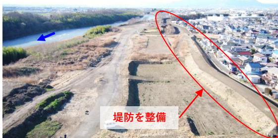
事業後のイメージ