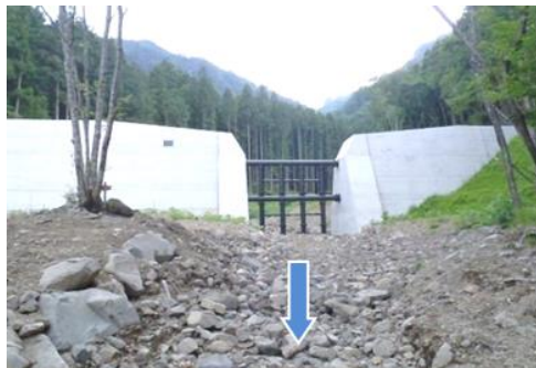
事業後のイメージ