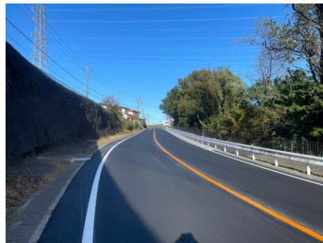
事業後のイメージ（一例）