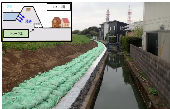
事業後のイメージ