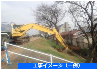
工事イメージ（一例）