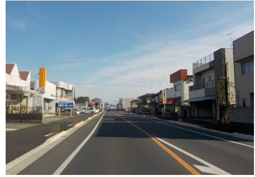
事業後のイメージ