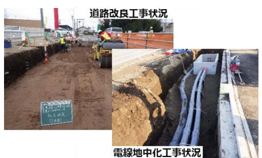
道路改良工事状況