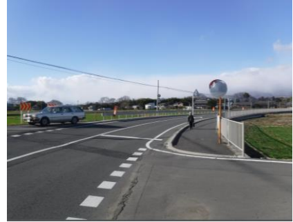
事業後のイメージ