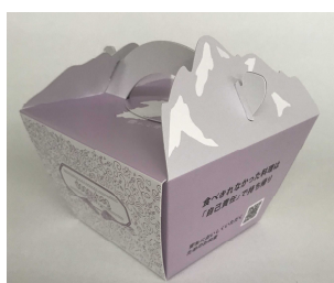
持ち帰り容器(上毛バッグ)