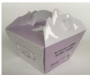
持ち帰り容器 ※1店舗につき50個 (Newドギーバッグアイデアコンテスト(環境省主催) 群馬県受賞作品「上毛バッグ」)