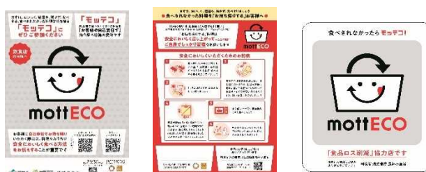
普及啓発物（ポスター、チラシ、ステッカー）