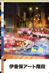
伊香保アート階段