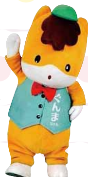
群馬県のマスコット ぐんまちゃん