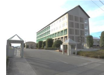
校舎正門入口外観