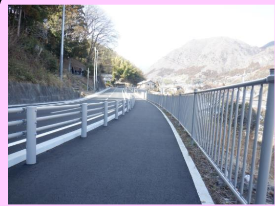
道路付属物は、透過性、周囲の景観に合わせた色彩を選定。