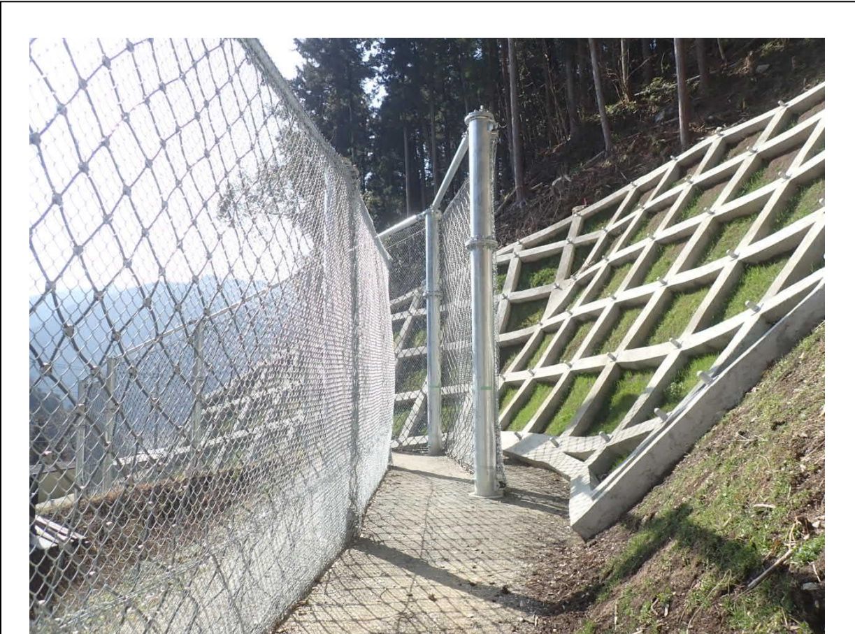
周辺の景観や植生との調和