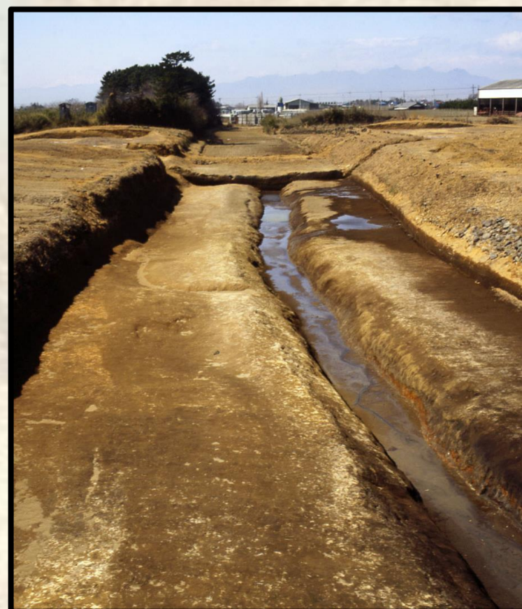
女堀発掘状況(前橋市飯土井町)