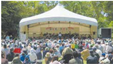
昨年度開催の様子

問 森とオーケストラ実行委員会事務局(高崎青年会議所内) (☎027-361-7604)