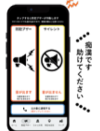
アプリ画面イメージ