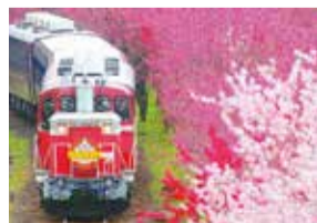
わたらせ渓谷鐵道